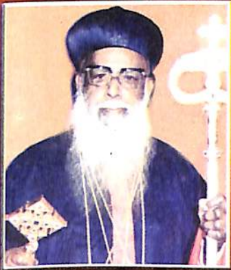
പ. ബസേലിയോസ് മാർത്തോമ്മാ മാത്യൂസ് പ്രഥമൻ കാതോലിക്കാ ബാവ